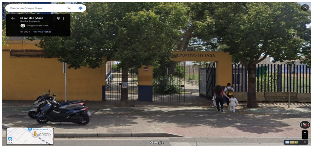
Imagen del punto de encuentro.

PUNTO DE ENCUENTRO: ENTRADA PRINCIPAL CENTRO DEPORTIVO HYTASA.