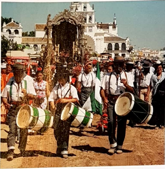
En las diferentes romerías de Andalucía, los instrumentos musicales tradicionales tienen un gran protagonismo.