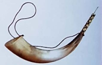
Gaita gastoreña (Aerófono de lengüeta)