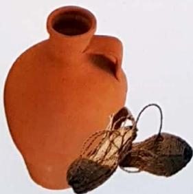
Cántaro (Idiófono percutido)