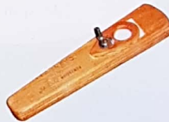
Pito de carnaval (Membranófono de sopro)