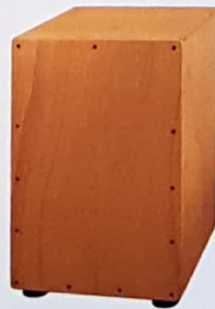
Cajón flamenco (Idiófono percutido)