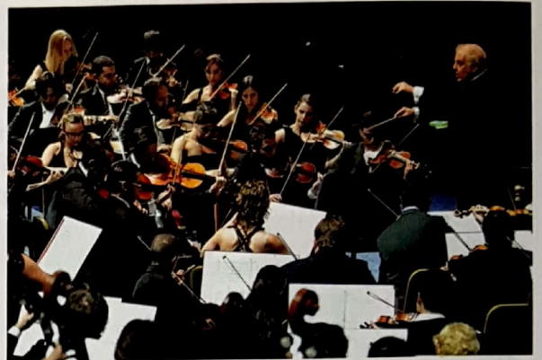
West-Eastern Divan Orchestra.

También destaca la labor interpretativa, formativa y de promoción de la OJA (Orquesta Joven de Andalucía) . Muchos de sus componentes son seleccionados para participar en giras de conciertos con la Joven Orquesta de la Unión Europea (EUYO) .