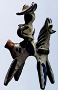
Pito de barro (Aerófono de bisel)